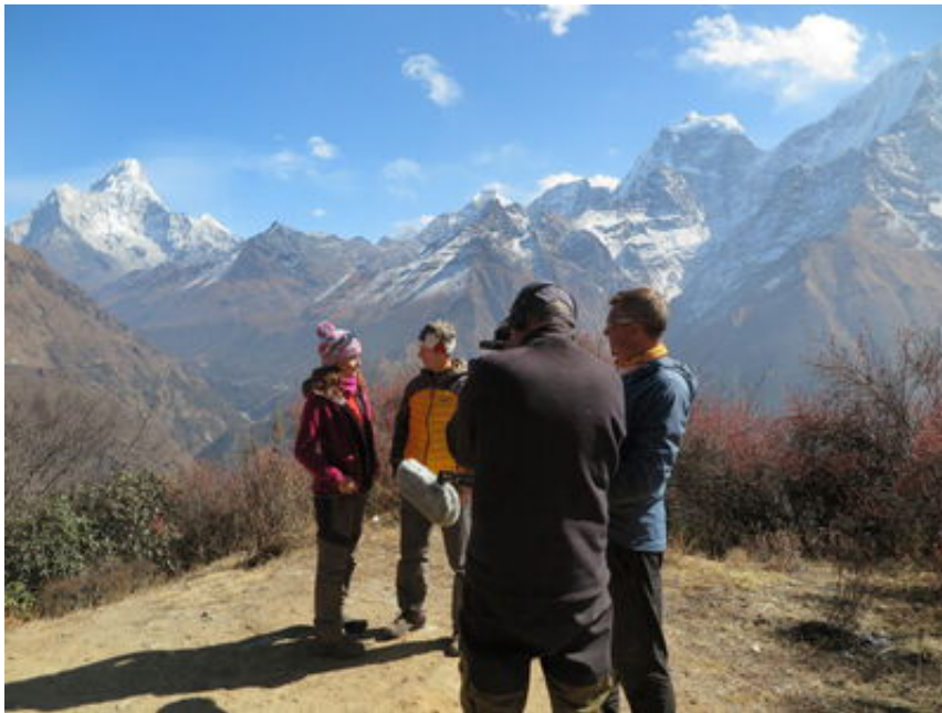
Nepal mit Jens Weißflog