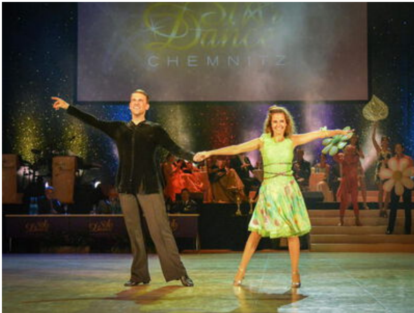
Stardance mit Tanzlehrer