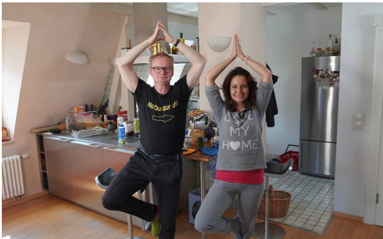
Yoga Spezial mit Uwe Steimle